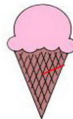
65. ice cr__ m